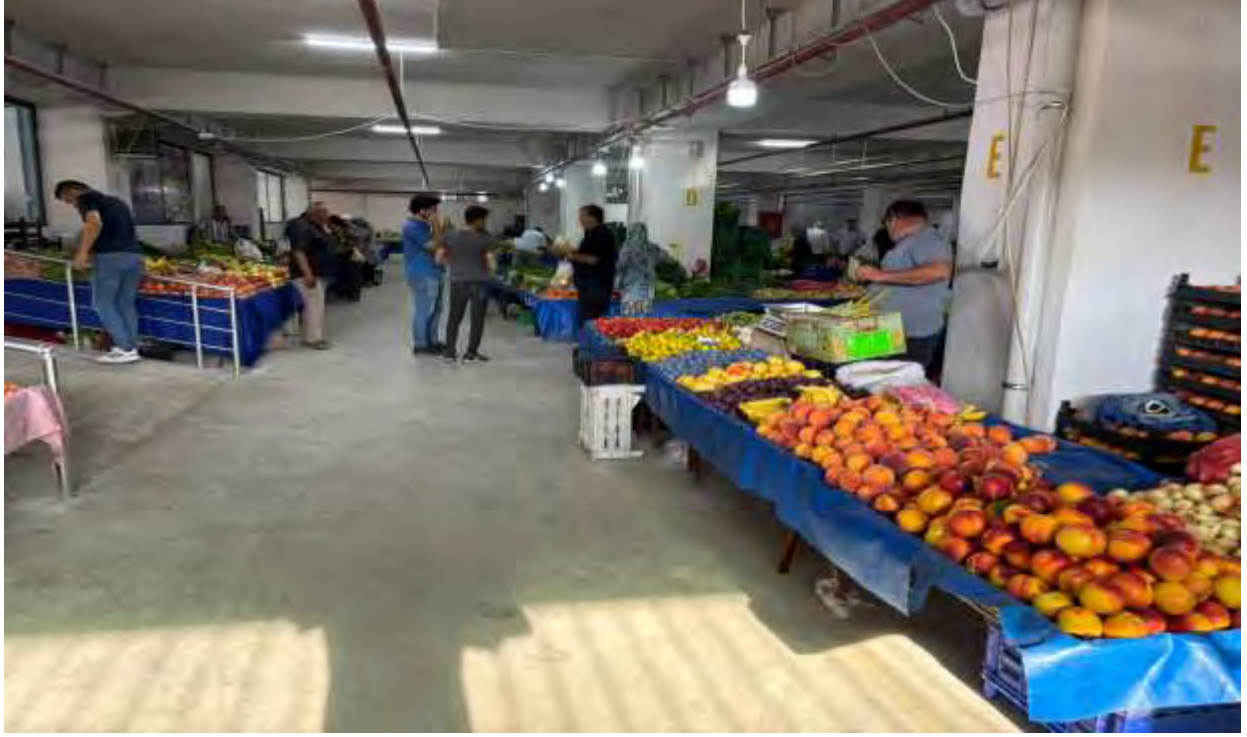
Pazaryeri kontrol ve denetimi yapıyor