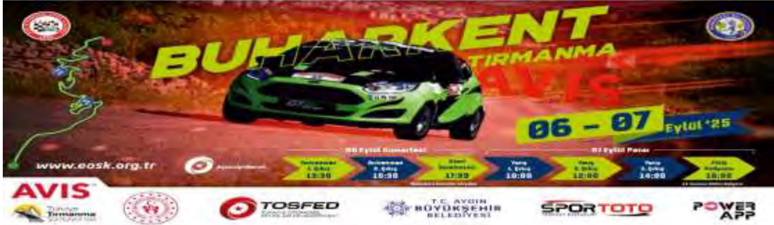
Otomobil Tırmanma yarışı yapıldı