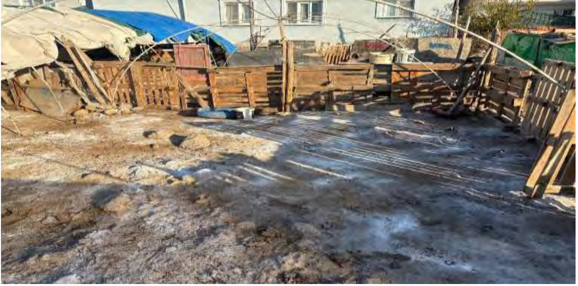
İlçemizde hayvan beslenen yerler denetlendi ve temizlik konusunda uyarıldı