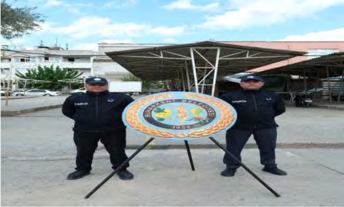
elek koyma merasimi