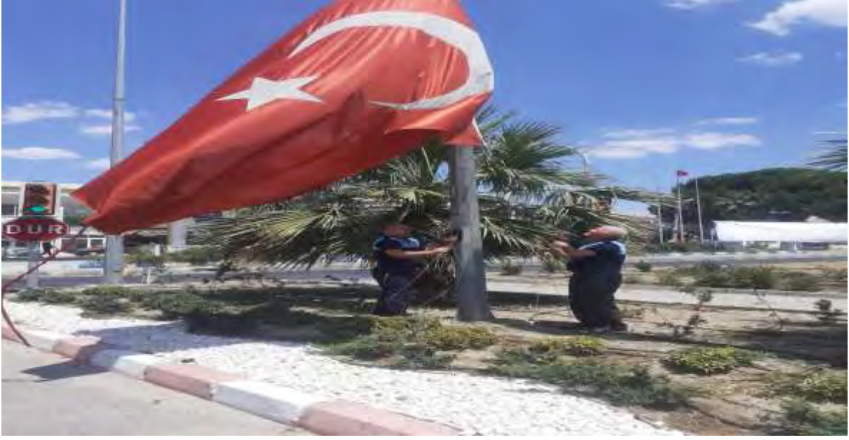
Zabıta tarafından yıpranan bayrak deęiřimi