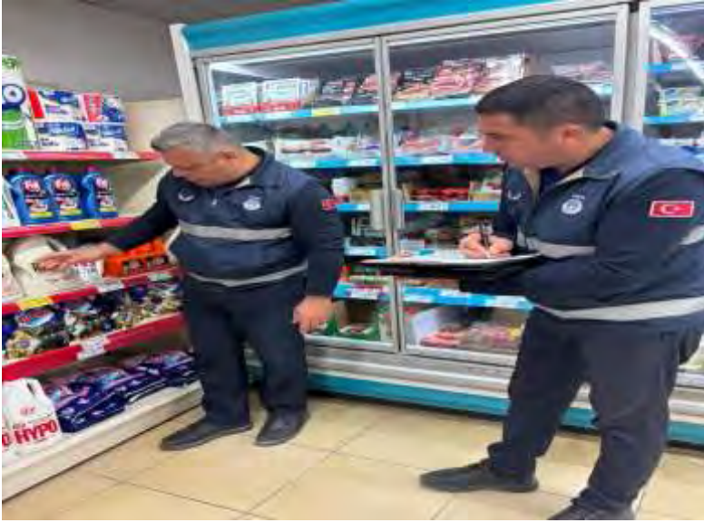
Marketlerde İlçe Tarım Ve Orman Müdürlüğü çalışanları ile fiyat ve gıda kontrolü yapıldı