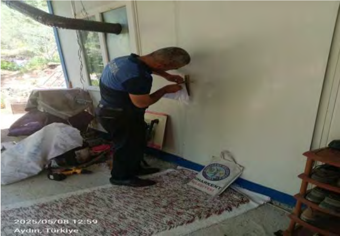
İlçemiz sınırları içerisinde yapılan kaçak yapılara mühür işlemi yapıldı