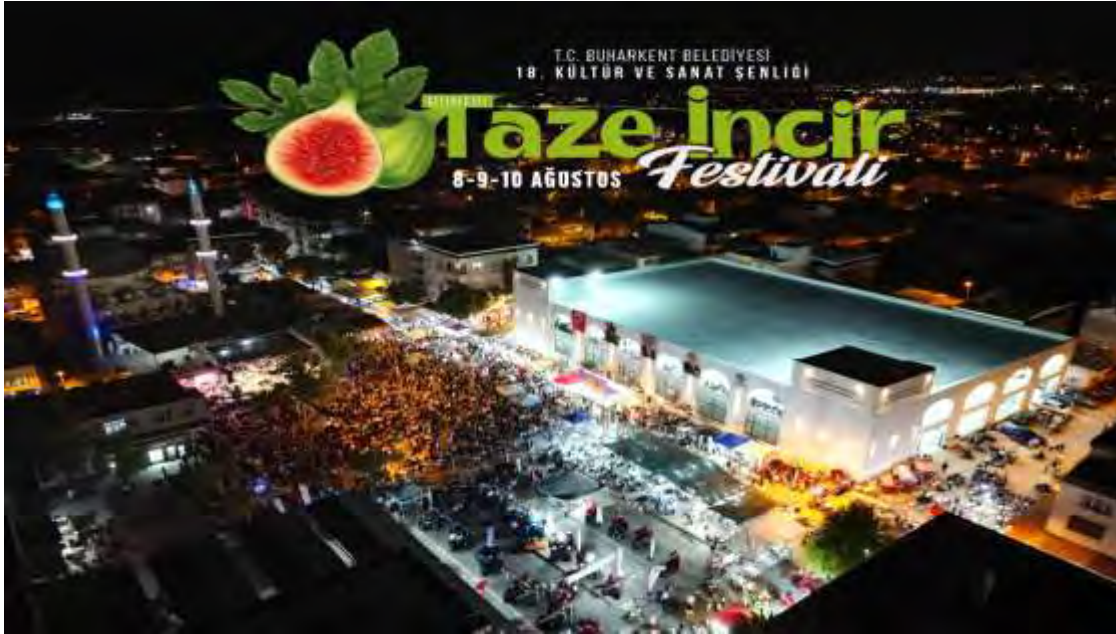
İncir Festivali Pazarıcı Yerleşimi Yapıldı