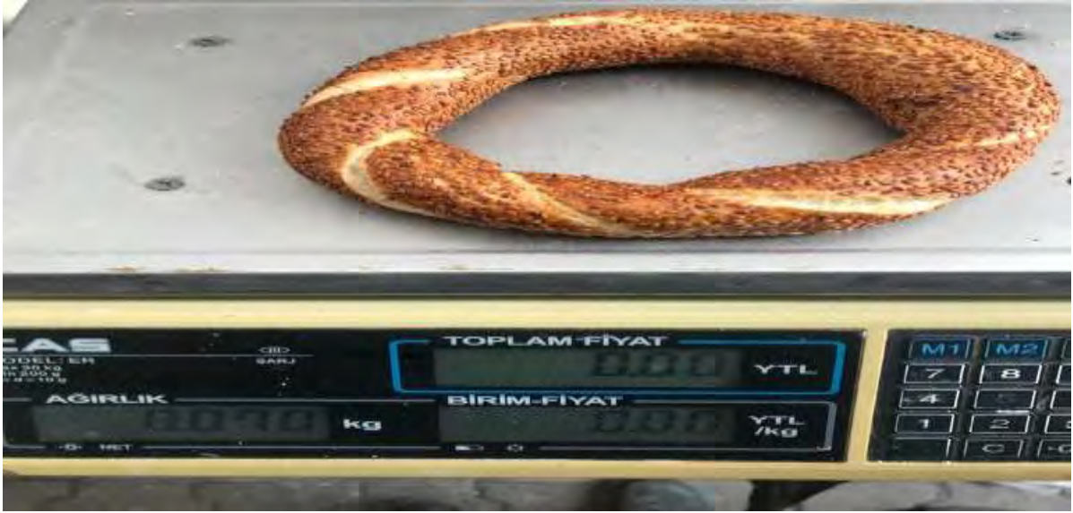
Simit gramaj kontrolü yapıldı.